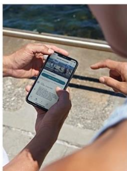
1. Descarga la app de adidas Running.