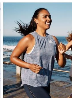
4. Registra cada kilómetro recorrido entre el 28 de mayo y el 8 de junio.