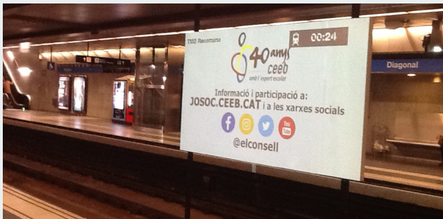
TMB i el CEEB comparteixen una mateixa visió de futur vers l'esport i els valors

L'anunci es projectarà entre les 5.00 i les 7.00 h., les 10.00 i les 17.00 h. i des de les 20.00 fins a