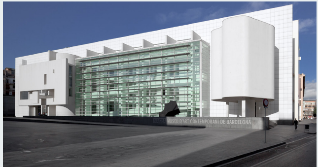
La plaça del MACBA és un punt de referència on conflueixen patinadors, ballarins i artistes

maran als participants. Un cop finalitzat l'esdeveniment, s'entregarà a cadascun dels corredors i corredores assistents amb un obsequi i una ració de pèrnil dolç per recuperar forces.